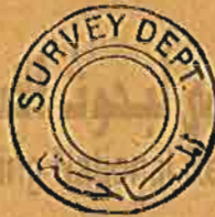
(شكل رقم ٢)

وهذا النوع يتكون من مسمار رأس مستديرة - أنظر الشكل رقم ٢