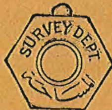
(شكل رقم ٣)

أو يتكون من رأس مسدس الشكل بأعلاه زر من النحاس - أنظر الشكل رقم ٣